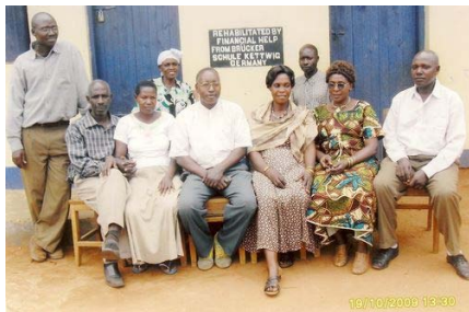
Das Kollegium der Bwagula Primary School